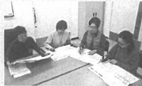
①音訳者打ち合わせ