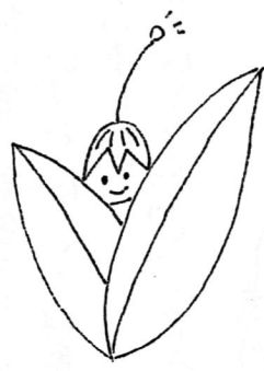
イラスト 山田 明子

さて、松戸市はどうでしょうか、 図書館の誕生の仕方の歴史が違 います。そして市民の要求には十分答 えてきたとは思いますが人口46万人 松戸都民といわれている市民の要求 は、当然かわってきます。常に研究し ていく必要があるのではないしょうか。 松戸市のこれからの図書館つくり 欠かすことのできない『図書館司書の 確立』と念学校図書館司書の充実 を、心にとめ今後の発展のために、 共にかんばりましょう。